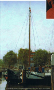
De laatste winterse foto's van de redactie van View & Visionaries

WARME WINTERJAS PORT: EEN RIJKE COMPLEXE W SPECIALE HORECA STAMTA DE DORDTENAREN EN HUN EVENEMENT INTERVIEW MET HANS SP DE DIGITALISERING VAN DORDRECHT TE PAARD DOOR MONCO SPRANKELENDE VOORWERPEN VOOR HET INTERIEUR EN NOG VEEL MEE